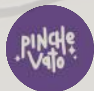
Ilustración: Saúl Canto García "Pinche Vato"

Studio Manager: Alonso Gutierrez Iluminación: Andrés Pozos Digitech & Post producción: Dan Álvarez Dirección de Arte: @pdp.media & @dancruzarte